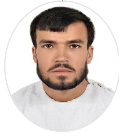
پوهنيار عبدالله آرام